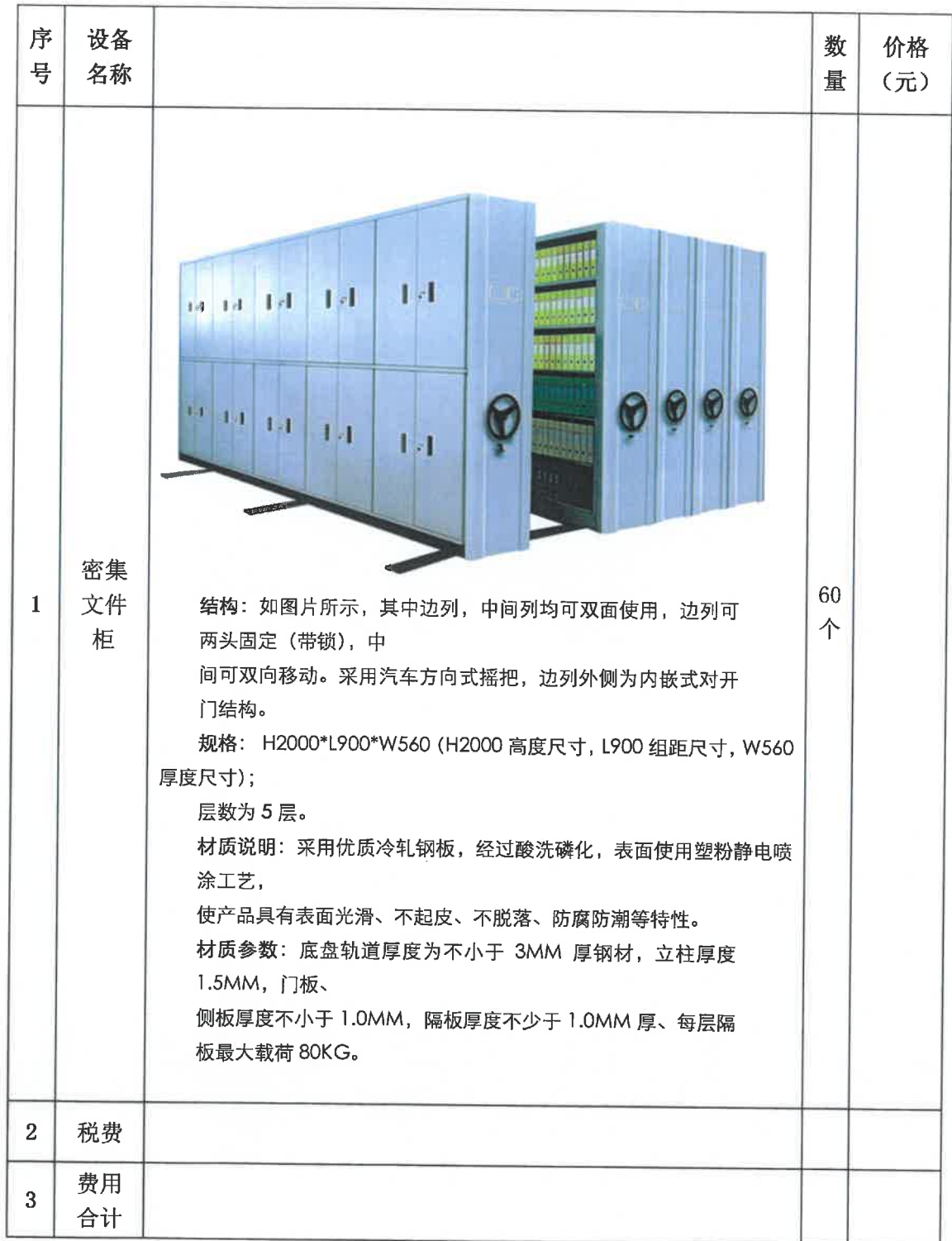
密集文件柜报价表

填表说明：1. 上表报价含税，以上报价均取小数点后两位，小数点后第三位四舍五入。